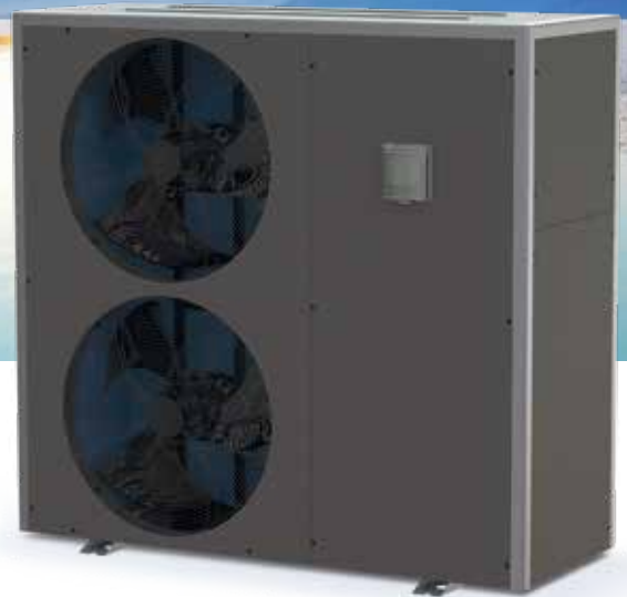
MASTER INVERTER XL Tri

Grâce à son système de régulation intelligente exclusif , la pompe à chaleur réversible Master-Inverter régule sa puissance en fonction de la température de l'eau mais aussi en fonction de la température ambiante afin de toujours assurer la bonne température de baignade, le meilleur COP* et le plus bas niveau sonore !